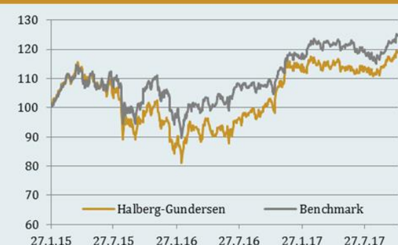
Udvikling i foreningens afkast versus benchmark siden start

Investeringsforeningen Halberg-Gundersen Invest og Great Dane A/S har alle rettigheder til dette produkt. Halberg-Gundersen Invest og Great Dane A/S påtager sig intet ansvar for, hvorvidt informationerne er fuldstændige, korrekte eller ajourførte. Anvendelsen sker alene på eget ansvar. Halberg-Gundersen Invest yder ikke investeringsrådgivning. I intet tilfælde er Halberg-Gundersen Invest og/eller Great Dane A/S ansvarlige for tab, der måtte opstå som følge af brugen af dette produkt. Den, der anvender informationen eller dele heraf, bør være opmærksom på, at informationen afspejles ved tidspunktet for tilblivelsen og derfor hurtigt kan blive uaktuel. Opsparing gennem afdelinger i en investeringsforening indebærer altid en risiko. Historiske afkast er ingen garanti for fremtidige afkast. De penge, der placeres i en afdeling af en investeringsforening, kan både øges og mindskes i værdi, og det er ikke sikkert, at placeret kapital tilbagevindes.